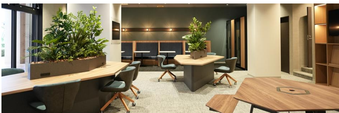
▲ コワーキングエリア