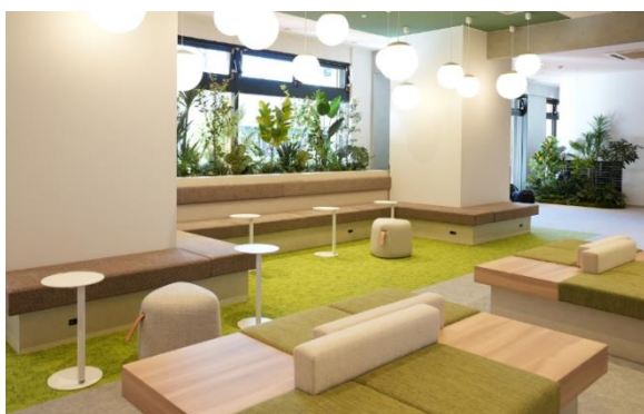
▲ コミュニケーションエリア ▲